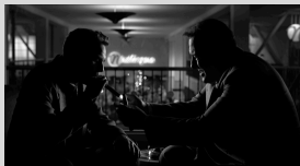
2x 3/4 Contre-Jour croisés