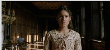
Le Nouveau Monde