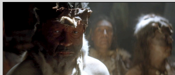
Le Nouveau Monde